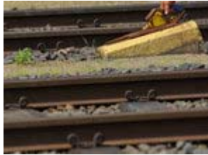
Hafenbahn