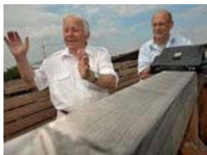
Auf der Eisenbahnbrücke

"Es hat sich viel verändert", sagt er ohne Sentimentalität. "Lauf der Zeit." Und die währt schon ganz schön lange. Von 1949 bis 2009 können Jung und Jünger die Geschichte der Hafenbahn aus eigenem Erleben rekonstruieren. Sie gehen hinter das Bahnhofsgebäude, vorbei am buddhistischen Kloster, das früher mal Druckerei war, zur Brücke übers Gleisfeld. Früher sind hier Züge rüber zum Seckbacher Industriegebiet gerollt, sagen sie. Die Schienen sind längst durch Bohlen ersetzt, die Brücke ist zum Fußweg in den Riederwald geworden. Die Männer zeigen, wo die Gleiswaage stand, "heute ist eine elektronische Waage in den Schienen installiert", sagt Jünger. Oder wo die vier Stellwerke waren, Stationen, an denen die eingehenden Züge und Waggons angenommen, sortiert, abgestellt und fürs neue Ziel übergeben wurden.